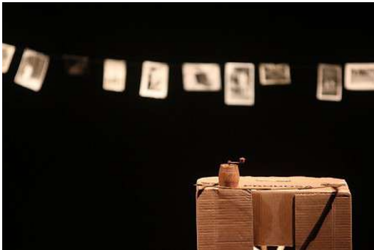
Compagnie Perpétuel détour – Des ailes à nos bouches

Les spectacles de la compagnie mêlent, tout en poésie, tantôt : le théâtre, la musique, le chant, le théâtre d'objets et la marionnette.